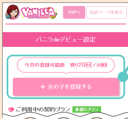
バナラdeデビュー設定TOP